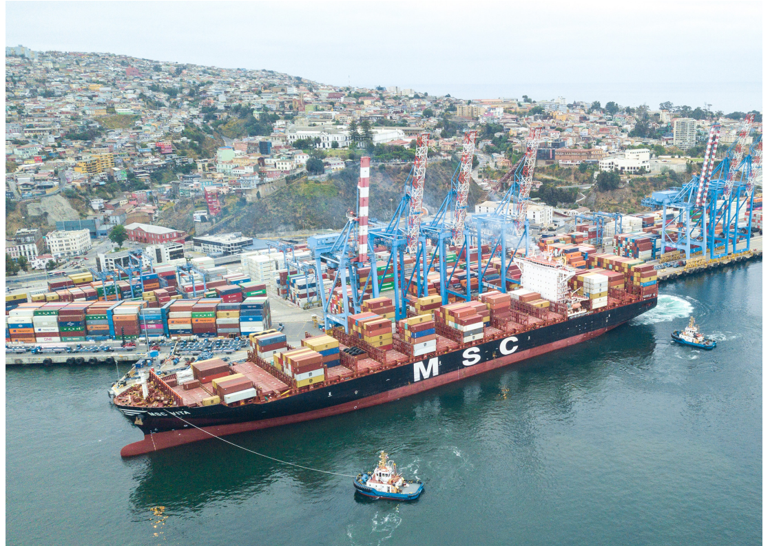
TPS ha mantenido la competitividad de Valparaíso a través de la excelencia en sus operaciones.

Nuestro terminal es el punto de salida de 1 de cada 3 frutas que Chile exporta. Comprometidos con el turismo de nuestra región a través de una atención de excelencia a los cruceros, hemos trabajado sistemáticamente para captar nuevas líneas.