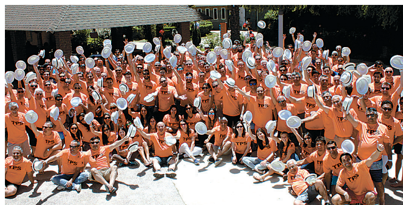
El equipo de colaboradores de TPS da sentido a todo su trabajo.