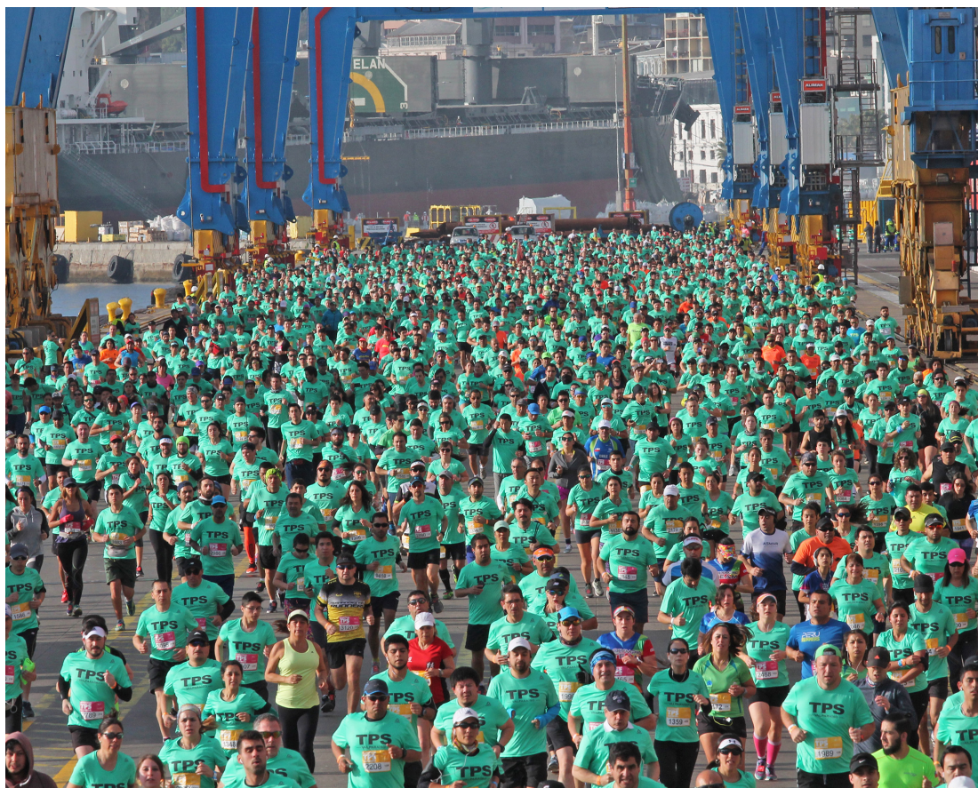
Un recorrido único por el interior del terminal es parte de la Media Maratón TPS.